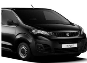
Sort Perla Nera (9VM0) Metallak