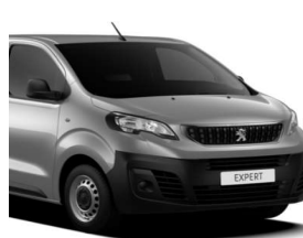
Grå Artense (F4M0) Metallak