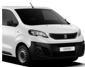
Hvid Icy (PRP0) Standardlak