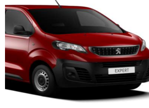
Rød Ardent (X9P0) Speciallak

Leveringsomkostninger: Kr. 4.220,- ekskl. moms.