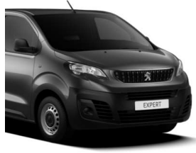
Grå Platinum (VLM0) Metallak